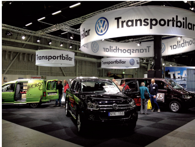
Volkswagens monter med Cross Caddyn. FOTO: Flemming Nielsen

Till höger Amarok Wolf Special med extrautrustning. FOTO: Flemming Nielsen