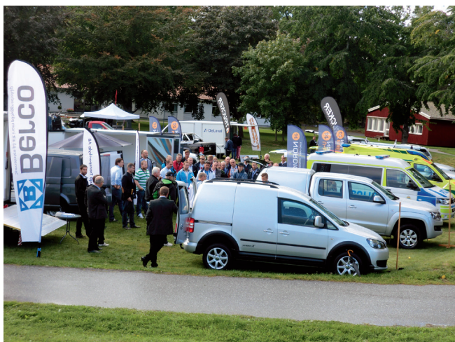
Bland utställarna fanns många av SKT:s leverantörer och andra påbyggnadsföretag.