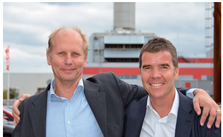
Det var glada miner från företagsledningen när företagsförvärvet presenterades för personalen och det långa samarbetet äntligen kunde leda till ett samgående.

SKT började redan 1925 som ett internationellt speditörsföretag. Först efter andra världskriget startades en avdelning för järnvägstransporter av importbilar till Sverige. 1976 kompletterades SKT med en PDI-anläggning i Halmstad.