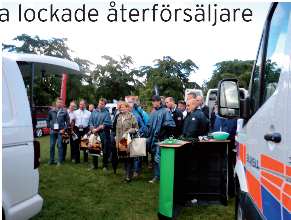
Runt 300 återförsäljare medverkade vid årets VW-utbildning av bilmodeller och kampanjer.